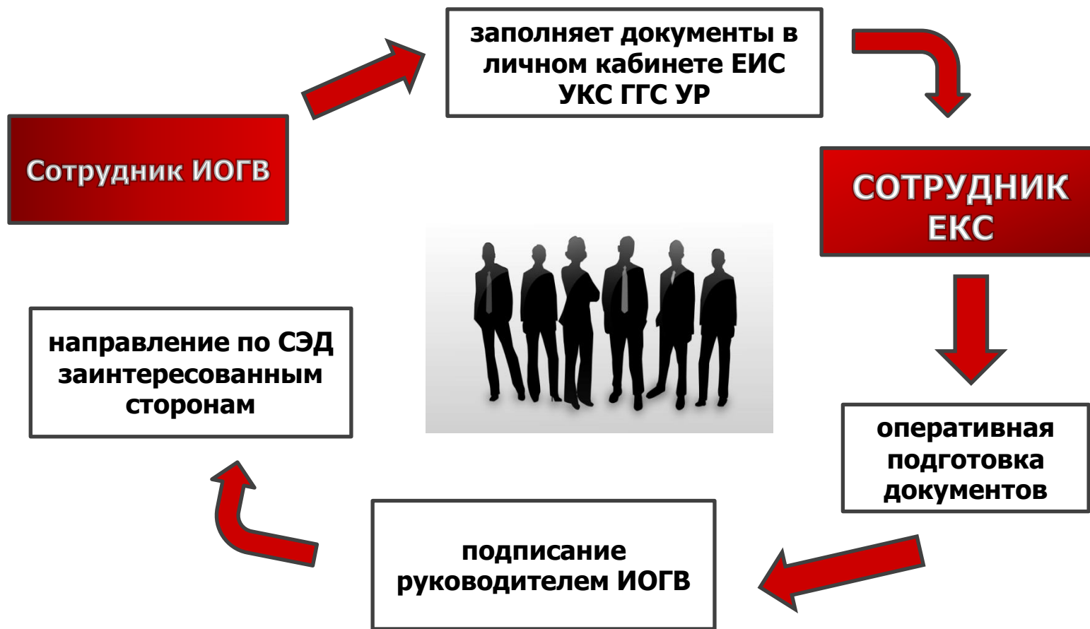
СХЕМА ВЗАИМОДЕЙСТВИЯ ЕКС С ИОГВ с 01.01.2020