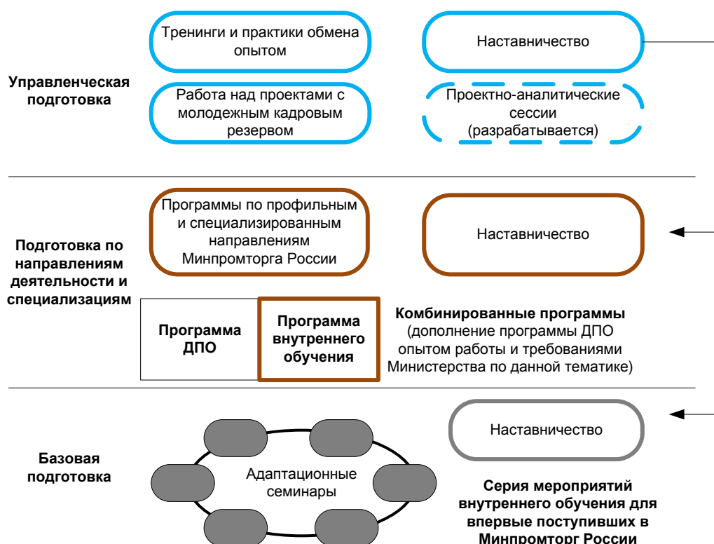
Схема 1. Структура и форма реализации мероприятий внутреннего обучения

Система внутреннего обучения Министерства основана на практиках обмена опытом и используется как в рамках адаптации поступивших на государственную гражданскую службу в Министерство, так и в целях профессионального развития кадрового состава по специальным и управленческим направлениям подготовки. Мероприятия внутреннего обучения направлены на освоение государственными гражданскими служащими норм, требований, а также профильных и специализированных знаний и навыков, используемых в Минпромторге России.